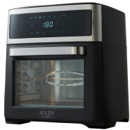
AIR FRYER OVEN AD 6309