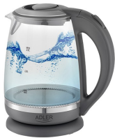
ELECTRIC KETTLE AD 1286