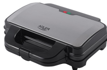
SANDWICH MAKER AD 3043