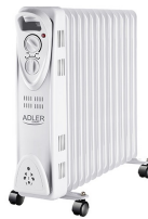
OIL-FILLER RADIATOR AD 7811