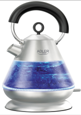
Electric Kettle AD 1282