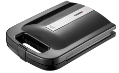
Sandwich Maker AD 3055