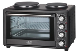
Electric Oven With HOB AD 6020