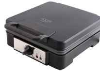
WAFFLE MAKER AD 3049