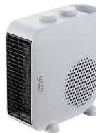
FAN HEATER AD 7725