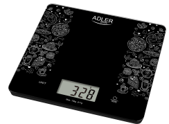
KITCHEN SCALE AD 3171