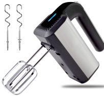
MIXER AD 4225