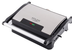
ELECTRIC GRILL AD 3052