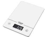
KITCHEN SCALE AD 3170