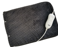
HEATED PAD AD 7433