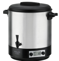
PASTEURIZATION POT AD 4496