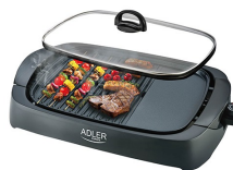
ELECTRIC GRILL AD 6610