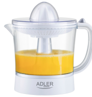
CITRUS JUICER AD 4009