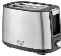
TOASTER 2 SLICE AD 3214