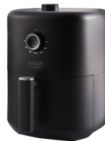
AIR FRYER AD 6310