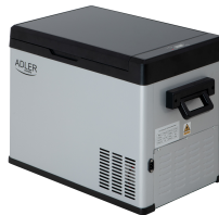
PORTABLE FRIDGE AD 8077