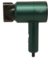
HAIR DRYER AD 2265