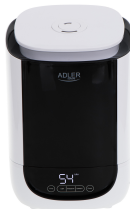
AIR HUMIDIFIER AD 7966