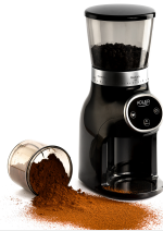
Burr Coffee Grinder AD 4450