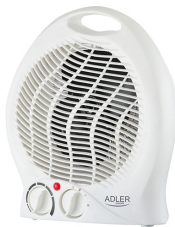
FAN HEATER AD 7728