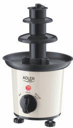
CHOCOLATE FOUNTAIN AD 4487