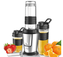
PERSONAL BLENDER AD 4081