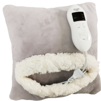
HEATED PAD AD 7412