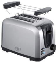
TOASTER 2 SLICE AD 3222