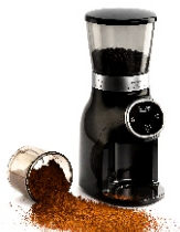
Burr Coffee Grinder AD 4450