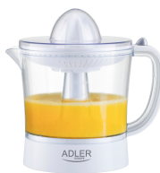
CITRUS JUICER AD 4009