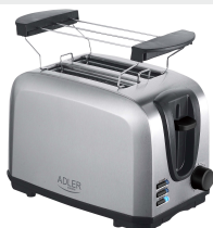
TOASTER 2 SLICE AD 3222