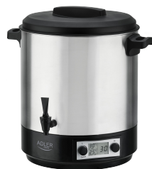
PASTEURIZATION POT AD 4496