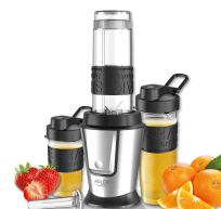
PERSONAL BLENDER AD 4081