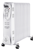
OIL-FILLER RADIATOR AD 7811