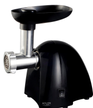
MEAT MINCER AD 4811