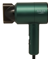
HAIR DRYER AD 2265