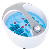
FOOT SPA AD 2177