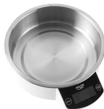
KITCHEN SCALE AD 3166