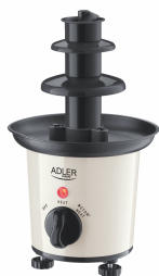
CHOCOLATE FOUNTAIN AD 4487