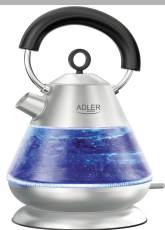
Electric Kettle AD 1282