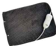
HEATED PAD AD 7433