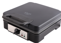
WAFFLE MAKER AD 3049