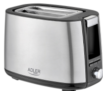
TOASTER 2 SLICE AD 3214