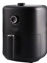
AIR FRYER AD 6310