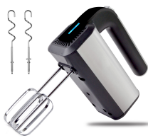
MIXER AD 4225