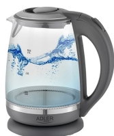
ELECTRIC KETTLE AD 1286