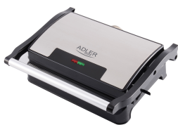
ELECTRIC GRILL AD 3052