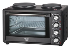
Electric Oven With HOB AD 6020