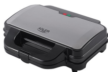
SANDWICH MAKER AD 3043