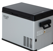
PORTABLE FRIDGE AD 8077