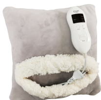
HEATED PAD AD 7412