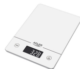
KITCHEN SCALE AD 3170