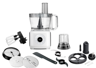
FOOD PROCESSOR AD 4224