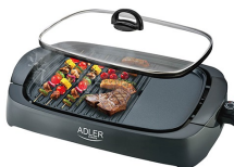
ELECTRIC GRILL AD 6610