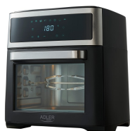
AIR FRYER OVEN AD 6309