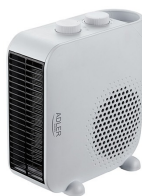
FAN HEATER AD 7725