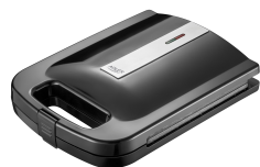
Sandwich Maker AD 3055