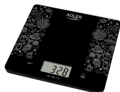
KITCHEN SCALE AD 3171