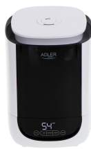
AIR HUMIDIFIER AD 7966