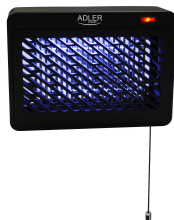
MOSQUITO LAMP AD 7938