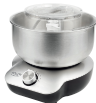
MIXER WITH BOWL AD 4222