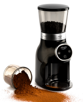
Burr Coffee Grinder AD 4450