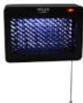
MOSQUITO LAMP AD 7938