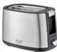
TOASTER 2 SLICE AD 3214