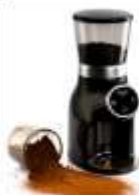
Burr Coffee Grinder AD 4450