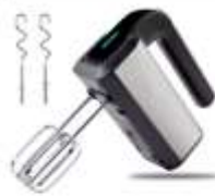
MIXER AD 4225