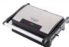
ELECTRIC GRILL AD 3052