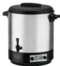
PASTEURIZATION POT AD 4496