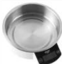
KITCHEN SCALE AD 3166