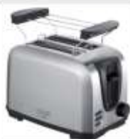
TOASTER 2 SLICE AD 3222