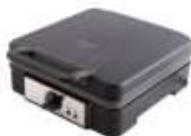
WAFFLE MAKER AD 3049