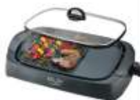
ELECTRIC GRILL AD 6610