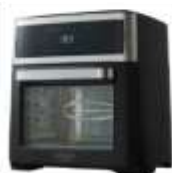
AIR FRYER OVEN AD 6309