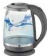
ELECTRIC KETTLE AD 1286