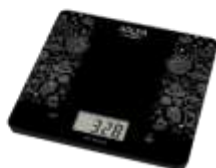
KITCHEN SCALE AD 3171