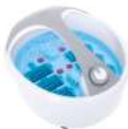
FOOT SPA AD 2177