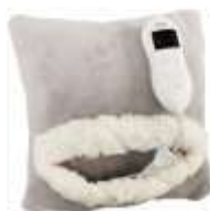
HEATED PAD AD 7412