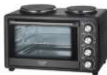
Electric Oven With HOB AD 6026