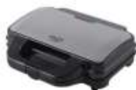
SANDWICH MAKER AD 3043