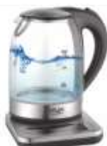
ELECTRIC KETTLE AD 1293