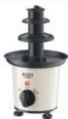
CHOCOLATE FOUNTAIN AD 4487