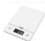
KITCHEN SCALE AD 3170