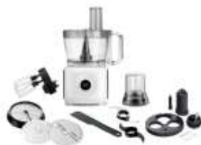
FOOD PROCESSOR AD 4224