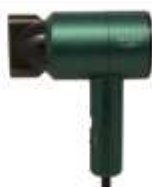
HAIR DRYER AD 2265