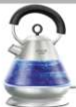
Electric Kettle AD 1282