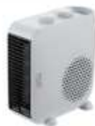
FAN HEATER AD 7725