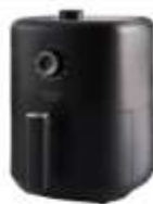
AIR FRYER AD 6310