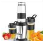
PERSONAL BLENDER AD 4081