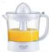
CITRUS JUICER AD 4009