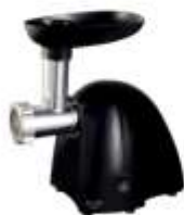
MEAT MINCER AD 4811