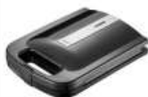
Sandwich Maker AD 3055