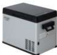
PORTABLE FRIDGE AD 8077