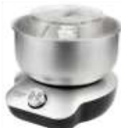
MIXER WITH BOWL AD 4222