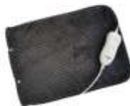
HEATED PAD AD 7433