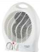
FAN HEATER AD 7728