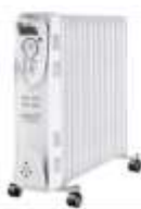
OIL-FILLER RADIATOR AD 7811