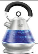
Electric Kettle AD 1282