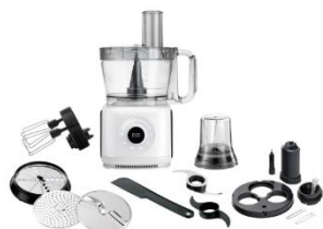
FOOD PROCESSOR AD 4224