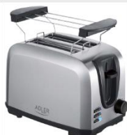
TOASTER 2 SLICE AD 3222