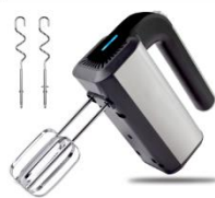
MIXER AD 4225