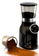
Burr Coffee Grinder AD 4450