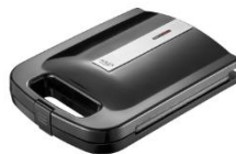
Sandwich Maker AD 3055