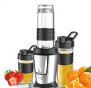
PERSONAL BLENDER AD 4081