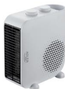
FAN HEATER AD 7725