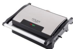
ELECTRIC GRILL AD 3052