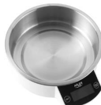
KITCHEN SCALE AD 3166