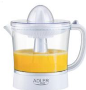
CITRUS JUICER AD 4009