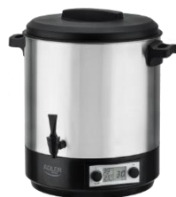
PASTEURIZATION POT AD 4496