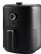
AIR FRYER AD 6310